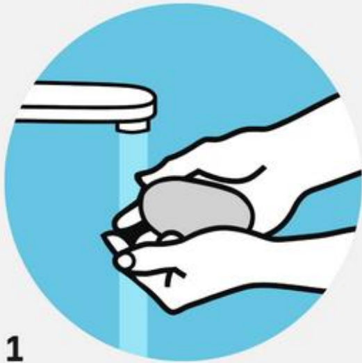
1 Намылить руки