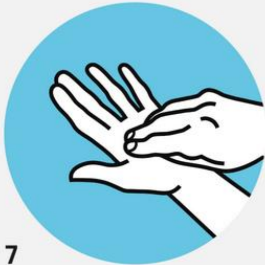
7 Подушечки пальцев