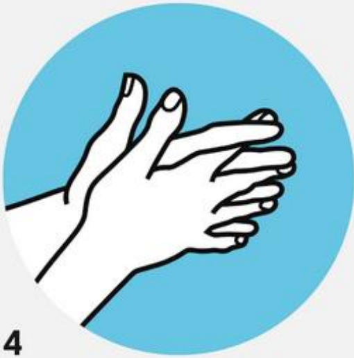
4 Между пальцами