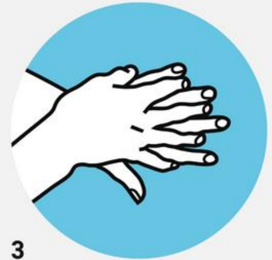
3 Обратную сторону ладоней