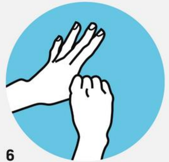
6 Большие пальцы