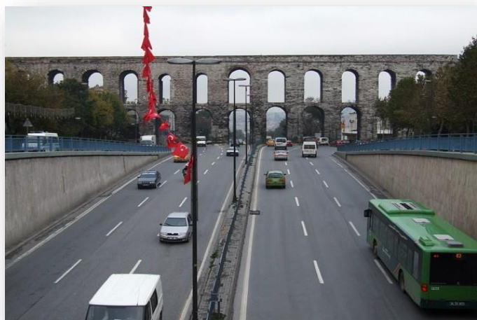
Дорога с акведуком

В 1987 году была построена экспериментальная четырехполосная бетоннопластиковая дорога, обеспечивающая высокий уровень устойчивости при поворотах и хорошую управляемость транспортом при движении даже на мокром покрытии.