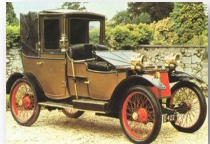
Автомобиль Ф. У Ланчестера

Английским пионером автомобилестроения был Фредерик Уильям Ланчестер, который произвел свой первый автомобиль в 1895 году. Двумя современными усовершенствованиями этого автомобиля были пневматические шины и колеса со спицами. С этого момента развитие автомобиля пошло очень быстро