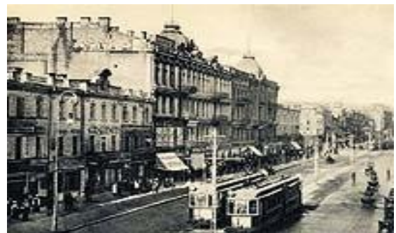
Электрический трамвай в Киеве