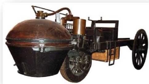
Машина Н-Ж. Кюньо

Машина Никола-Жозефа Кюньо управлялась рулем и была, по сути, двухцилиндровым паровым трактором. Двигатель располагался над единственным передним колесом. Повозка предназначалась для перевозки пушек, и ее скорость не превышала 5 км в час.