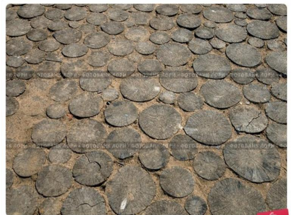
Торцовая деревянная мостовая

Очень удобными были торцовые мостовые, полотно которых образовывалось с помощью коротких бревен, поставленных рядом друг с другом.