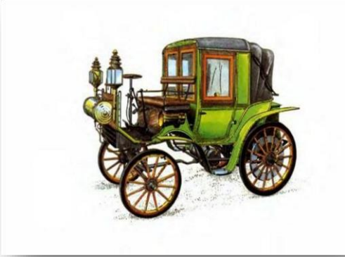
Автомобиль Готлиба Даймлера

Трудно сказать, кто первым построил автомобиль, работающий на бензиновом двигателе. Немец Готлиб Даймлер построил свой первый автомобиль с бензиновым двигателем в 1887 году, в том же году два француза запатентовали сцепление и коробку передач, которые в основном сохранились в неизменном виде в большинстве английских автомобилей до нашего времени.